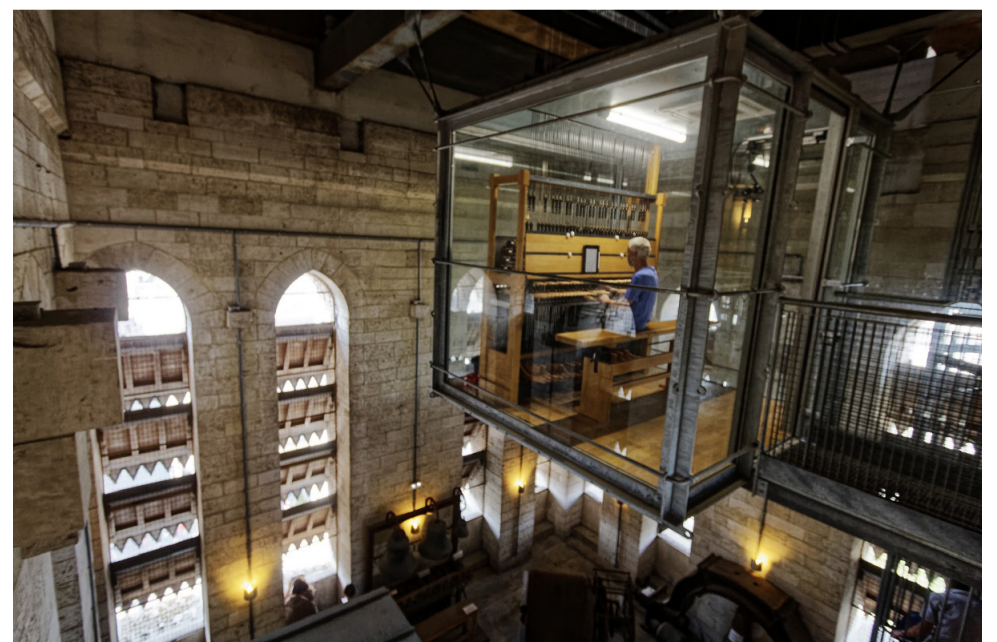
Le carillon est juché à plusieurs dizaines de mètres du sol. Le Bulletin