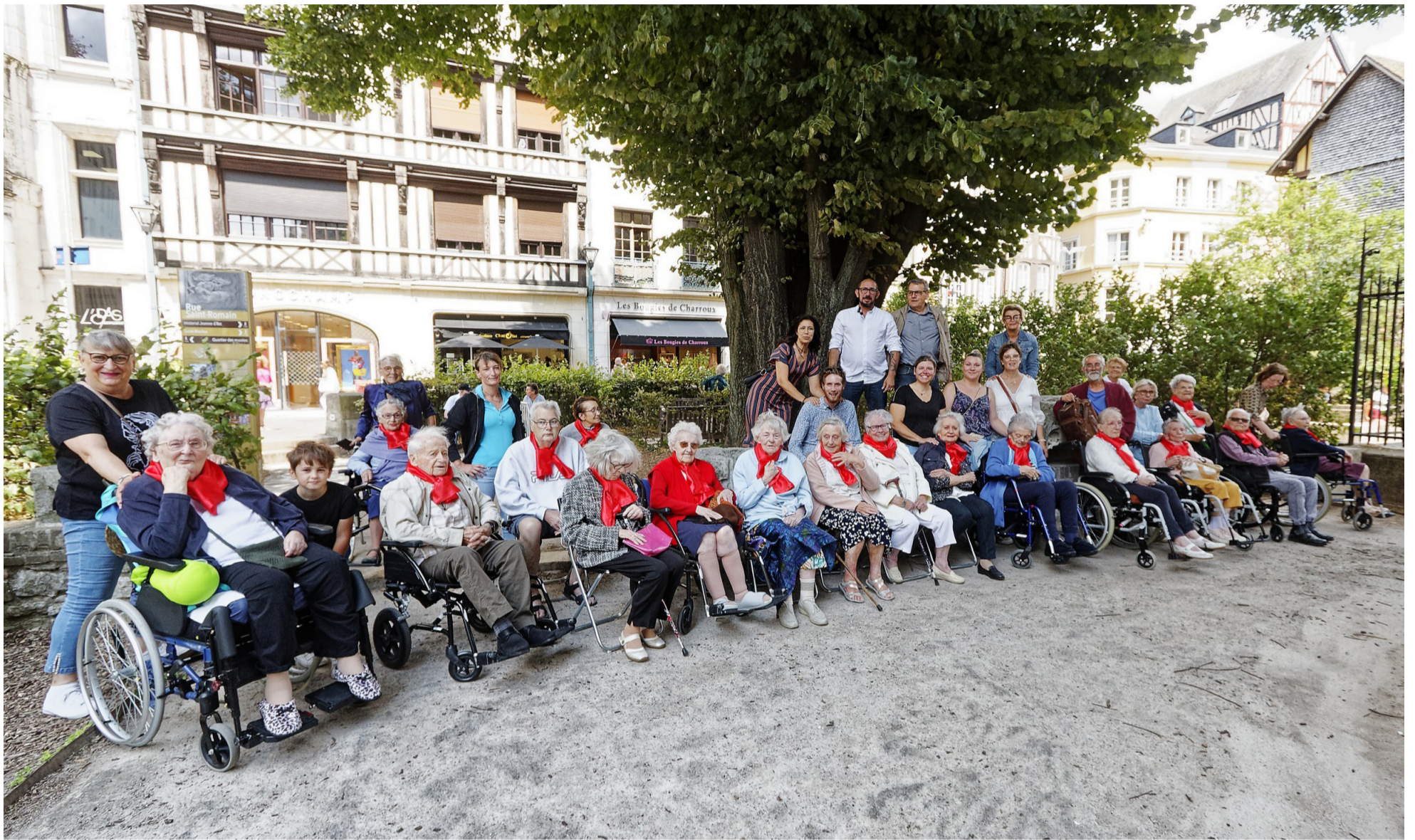
La Chorale des Hautes Bruyères a entonné son répertoire sous le carillon de la Cathédrale de Rouen. Le Bulletin