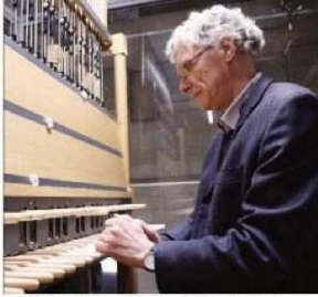
L'ACTU à gauche lors d'un événement de promotion de la cathédrale de Rouen, qui est répertorié avec ses 54 cloches.

Comment s'organise cet événement ? « C'est un moment très particulier, où nous nous réunissons pour accompagner des habitants du carillon pendant un quart de siècle. C'est une fête, une fête pour tous, une fête pour tous les carillonneurs. Ce sont des choses qui nous ont permis de passer un très bon moment et de partager avec les habitants de la région de Rouen. C'est une belle expérience que de pouvoir accompagner les habitants pendant un quart de siècle. C'est une belle expérience que de pouvoir accompagner les habitants pendant un quart de siècle. »