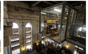
Le carillon est juché à plusieurs dizaines de mètres du sol.