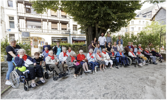
La Chorale des Hautes Bruyères a entendu son répertoire sous le carillon de la Cathédrale de Rouen.